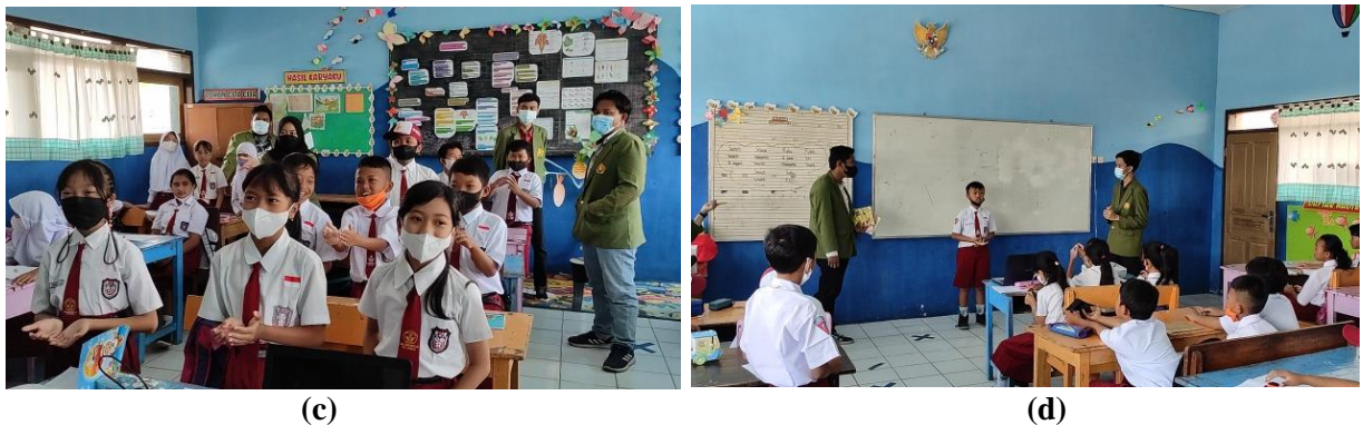
Gambar 3. (c) Diskusi interaktif dari materi yang dipaparkan, (d) Quiz

Dalam penjelasan materi yang diberikan dilakukan diskusi interaktif dengan para siswa dimana hal ini untuk menguatkan pemahaman para siswa. Pada akhir kegiatan edukasi pemilahan sampah, ditekankan kembali tentang sebuah persepsi bahwa sampah bukanlah sebagai sesuatu yang harus dihindari dimana bila dengan menganggap sampah adalah sesuatu yang harus dihindari menjadikan hilangnya rasa kepedulian dan kesadaran untuk mengolah dan mengelolanya. Oleh karena itu, adanya sampah adalah sebuah potensi dimana sentuhan ide dan kreatifitas dari para siswa dapat menjadikan sampah dapat menjadi sesuatu yang memiliki nilai, sebagai contoh sampah plastik dapat diolah menjadi berbagai kerajinan tangan seperti mobil mainan, tong sampah, cinderamata, hiasan kelas, tempat alat tulis, dsb.