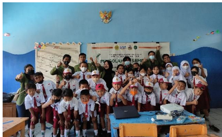
Gambar 4. Penutupan kegiatan